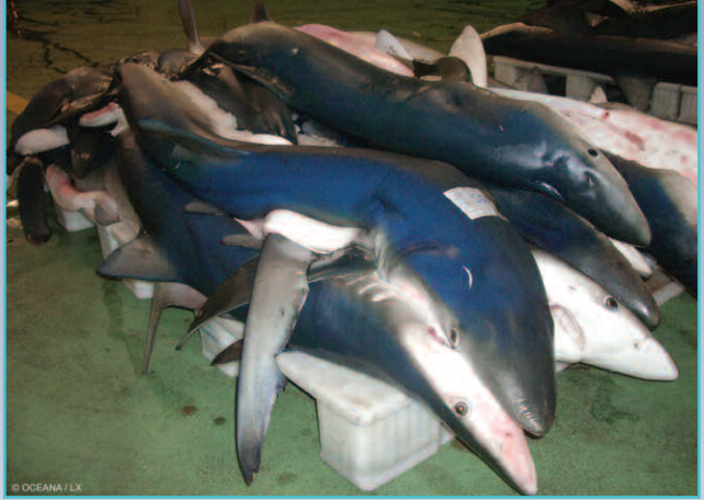
Tintorerías descargadas enteras. Lonja de Vigo, España. 2006.

Otros países han seguido esta tendencia responsable. Los países latinoamericanos que han seguido el ejemplo de Costa Rica con una política de aletas adheridas incluyen Panamá (para pesquerías industriales), El Salvador y Colombia. Esa misma estrategia se ha establecido en partes de Australia, Omán, Sudáfrica (para tiburones capturados en aguas sudafricanas) y los Estados Unidos (en pesquerías del Atlántico y del Golfo de México).