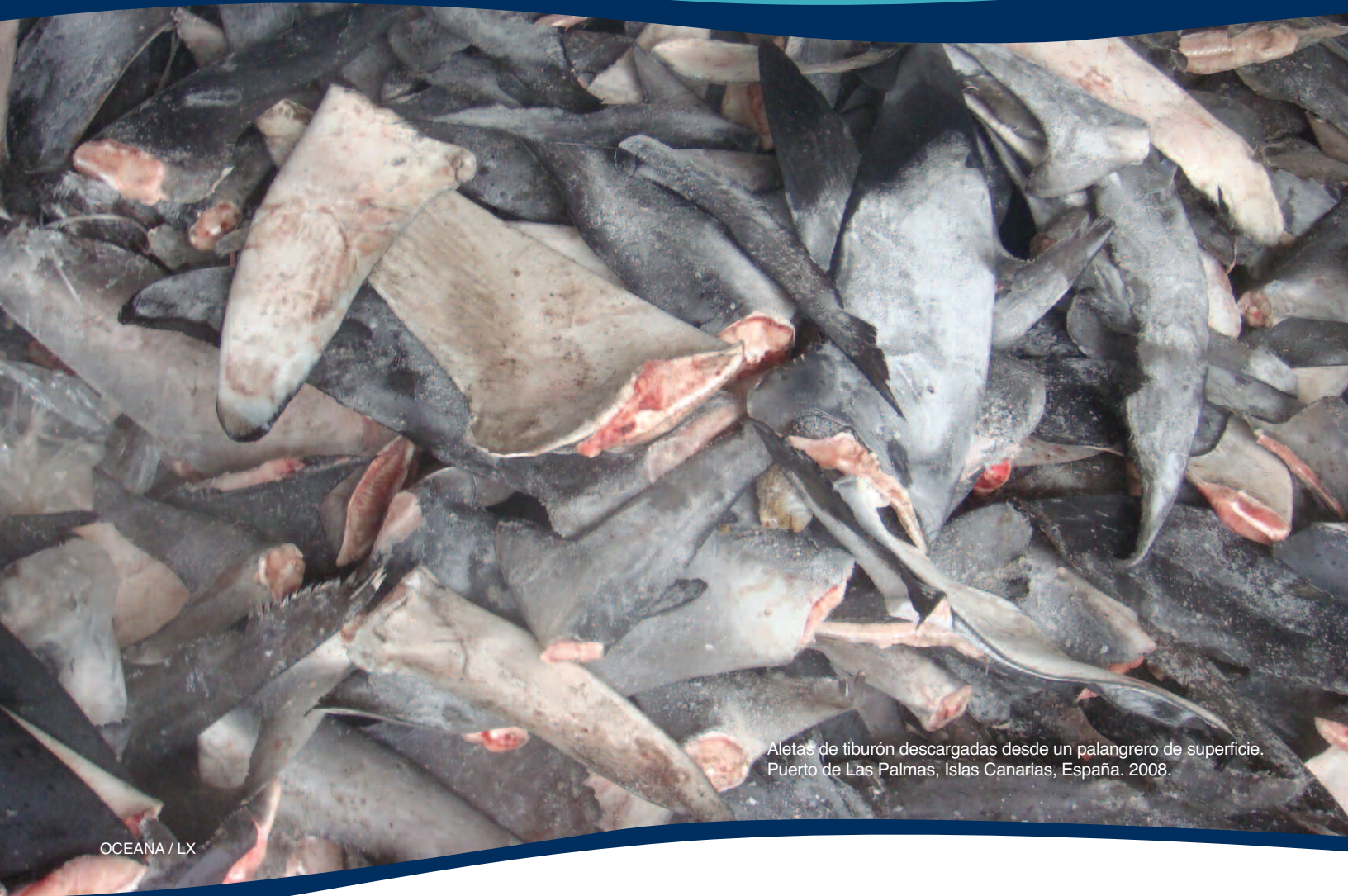
Aletas de tiburón descargadas desde un palangrero de superficie. Puerto de Las Palmas, Islas Canarias, España. 2008.