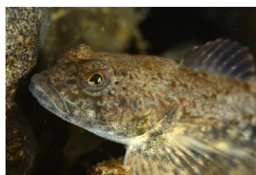
Stensimpa ( Cottus gobio ). Vapplan, Sverige.

I Kvarken lever 71 arter som är hotade, antingen på nationell nivå eller som behöver skydd genom EU-lagstiftningen. Bland arterna återfinns bl.a. harr ( Thymallus thymallus ) som är akut hotad i Östersjön. I området finns även en rad olika typer av habitat varav en del är hotade eller erkända som biologiska hetfläckar. Flertalet fiskarter som abborre, gädda, gös och sill leker i dessa vatten och en del av Kvarken har klassats som världsarv av Unesco.